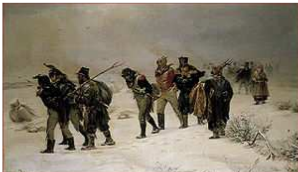
Ústup Francúzov (od ruského maliara Ilariona Prianišnikova)

Ruský cár Alexander (biely kráľ) odkryl dráhu svojej kráľovnej a dal Napoleonovi mat v Paríži.