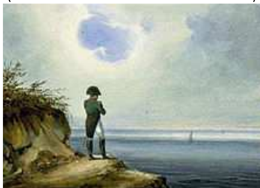
Napoleon bol v exile od roku 1815 na ostrove Svätá Helena v južnom Atlantiku, kde zomrel v roku 1821.