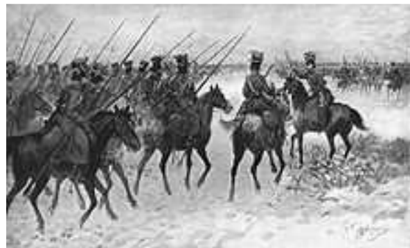
Ruská kavaléria (jazdeckto)