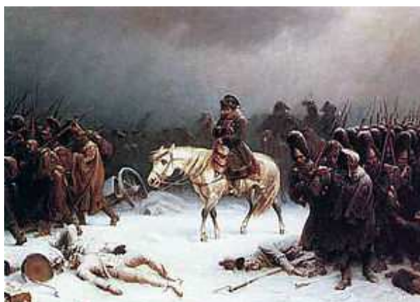
Útek Napoleona z Ruska Slávna maľba Adolfa Northena